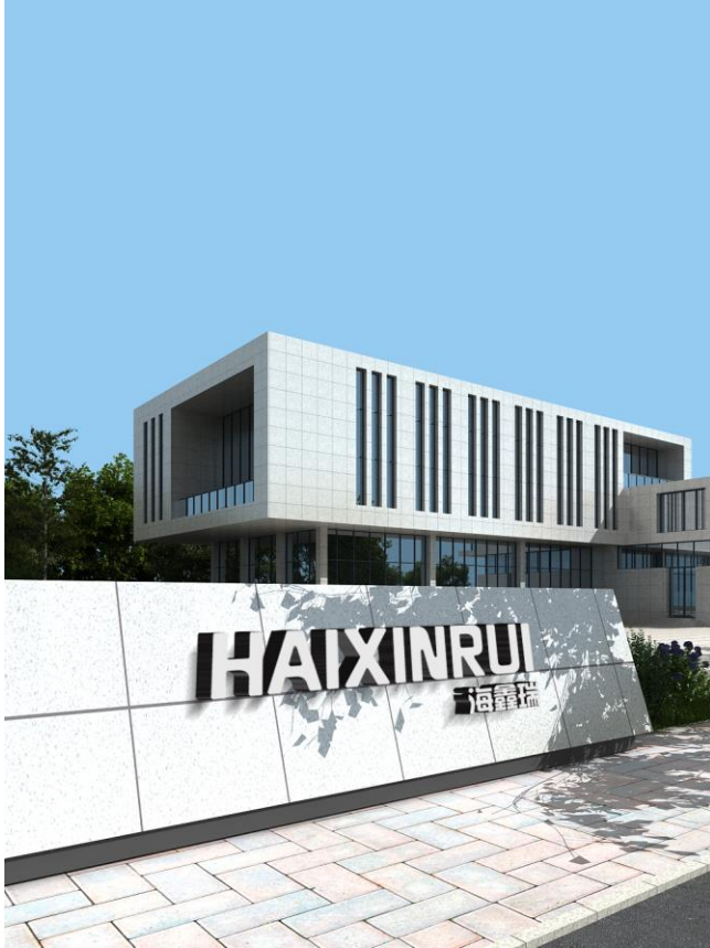
北京海鑫瑞科技有限公司 表面事业部